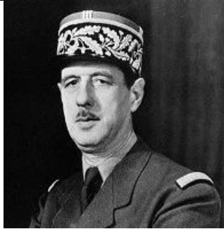
Charles de Gaulle

Pourquoi ces personnes sont-elles connues ?