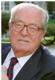
Jean Marie Le Pen