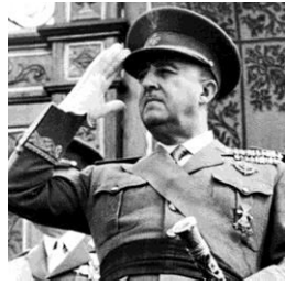
El general Francisco Franco