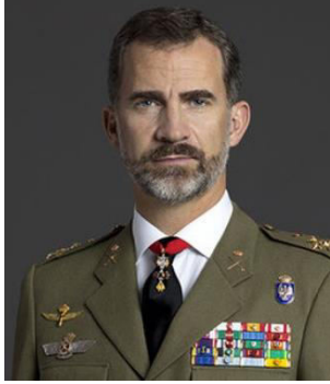
Felipe VI de España