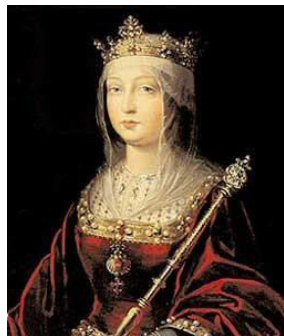
Isabel de Castilla